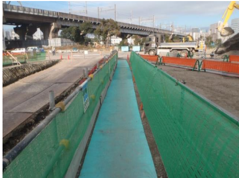
③安全通路にゴムマットを敷設