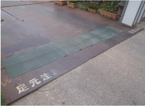
①ガイドワイヤーの養生