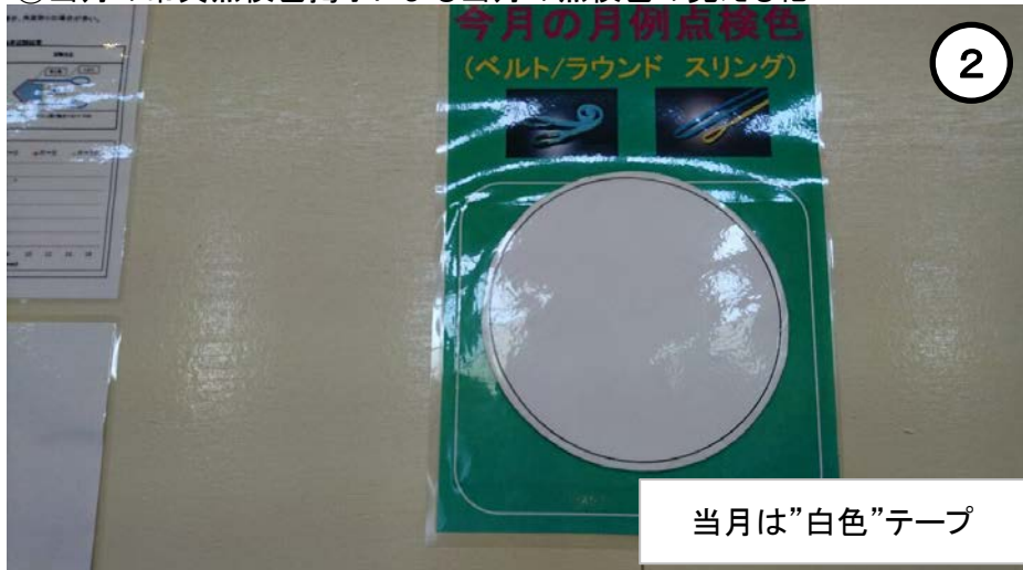
③当月の吊具点検色掲示による当月の点検色の見える化