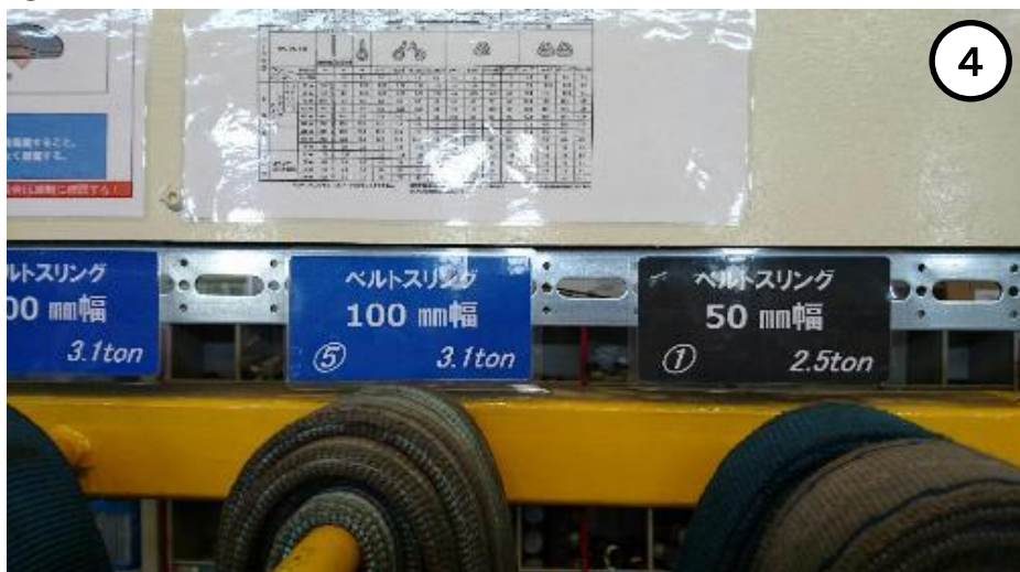
⑤吊具種類と吊り上げ能力の表示による定位置化