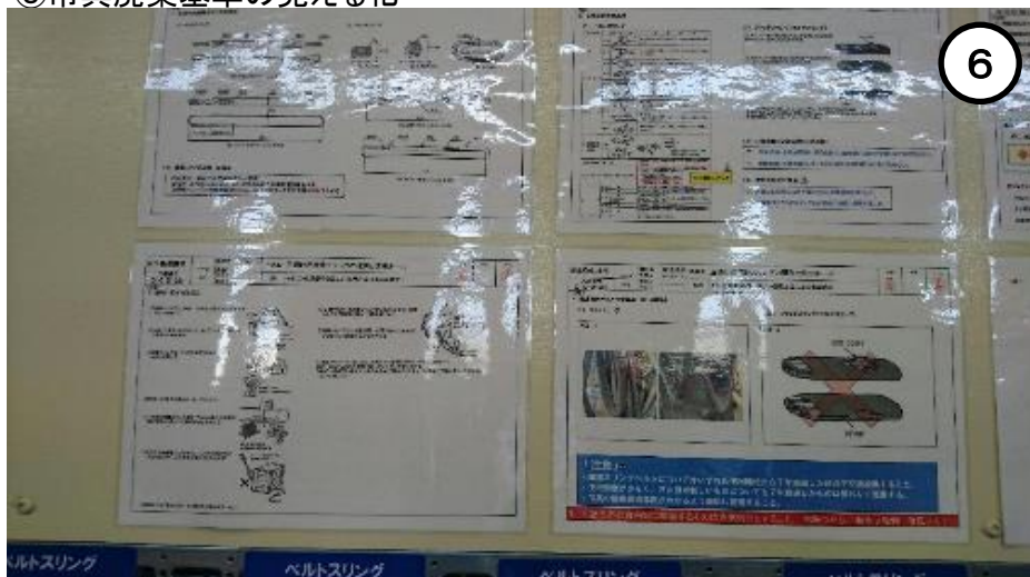
■スリングベルトの廃棄基準を制定し管理場所に掲示する