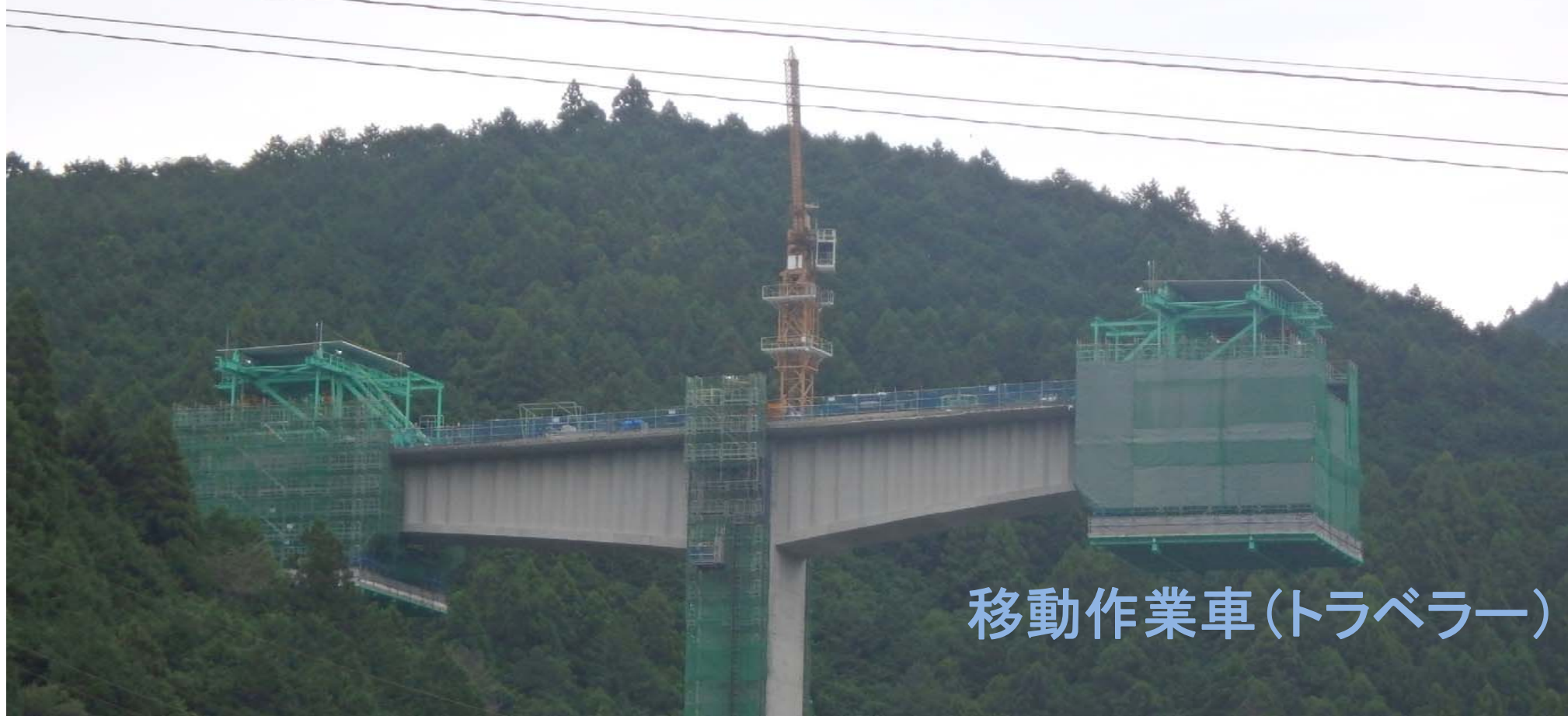
移動作業車(トラベラー)