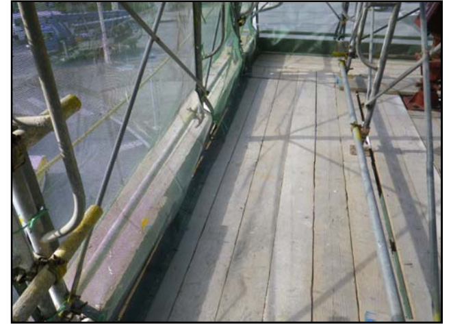
仮設ネット敷設前