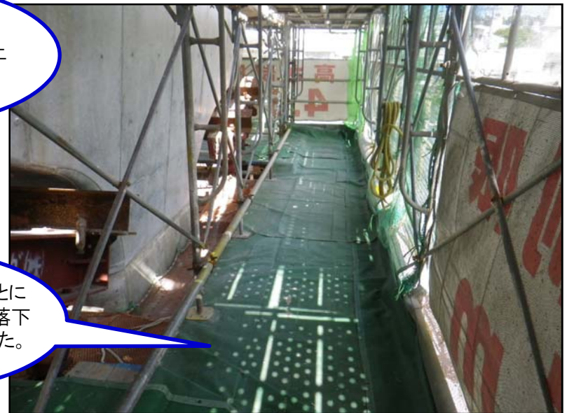
仮設ネット敷設後全景

足場板の隙間も防ぐこと により、小さなゴミや殻も落下 しないよう施工できました。