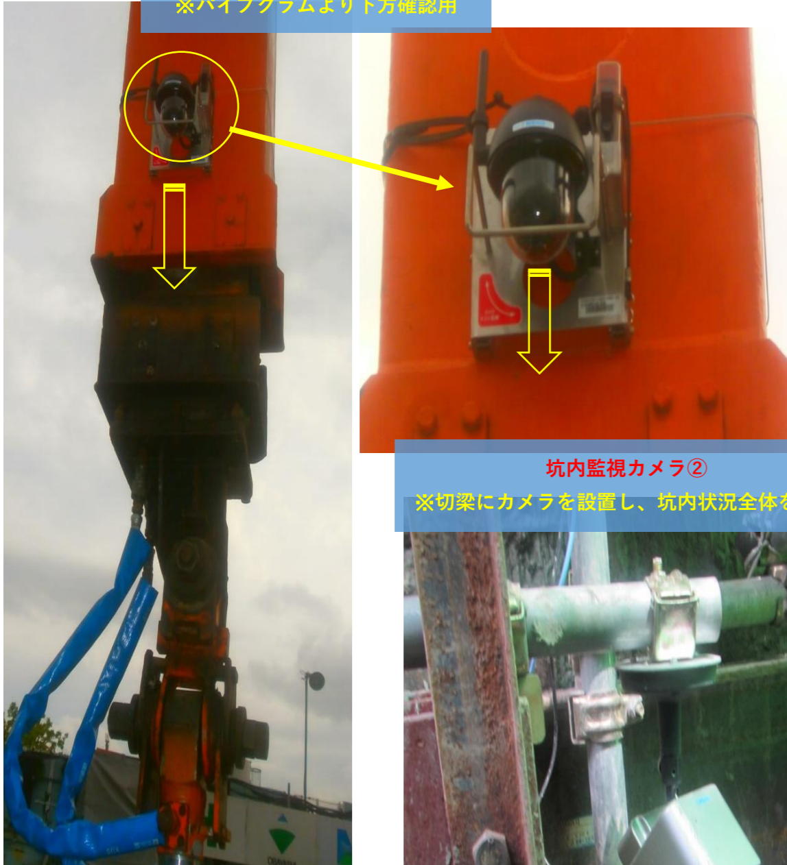
坑内監視カメラ② ※切梁にカメラを設置し、坑内状況全体を確認