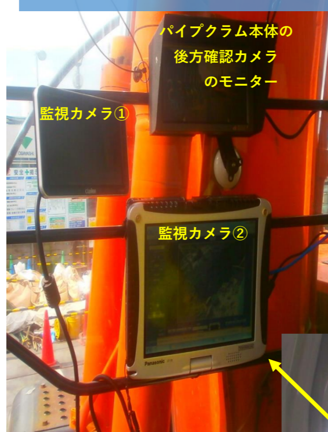
パイプクラム運転席のカメラモニター