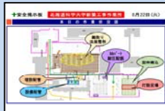
スライド② 本日の作業状況図