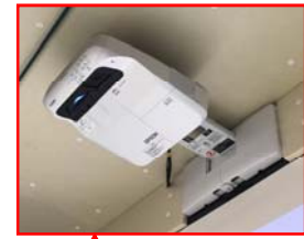
壁付型プロジェクター

SS-5 指差呼称 行動災害防止の徹底 全員参加で施設の点検 一人ひとりの分業 （事前点検） （事前点検） （事前点検）