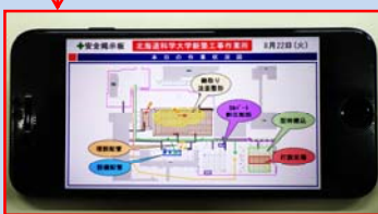
iPhoneにてPowerPointを使用し投影

SS-5 指差呼称 行動災害防止の徹底 全員参加で施設の点検 一人ひとりの分業 （事前点検） （事前点検） （事前点検）