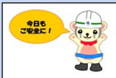
スライド⑤ キャラクターによるエール