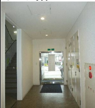
↑ 通路側（左側が階段）