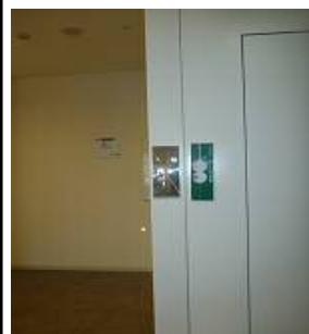
通路と階段側の真中に 衝突防止ミラー