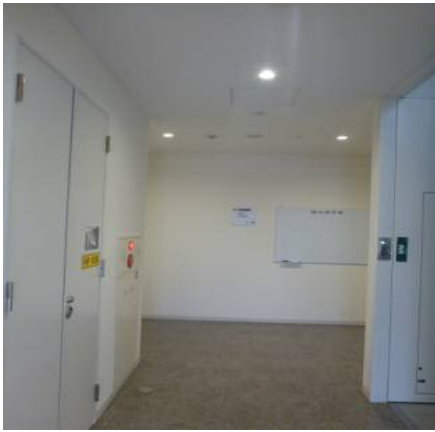
↑ 通路側（右側が階段）