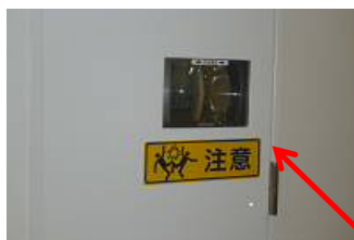
通路側に、衝突防止ミラー