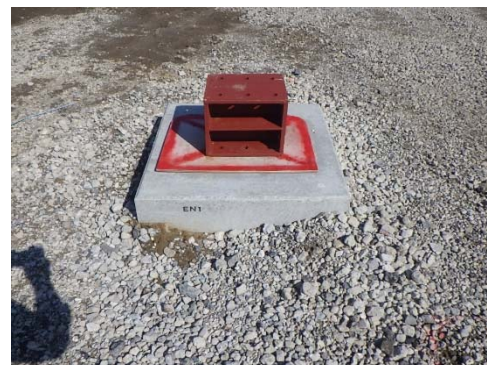
外構部の木板+鋼材による養生