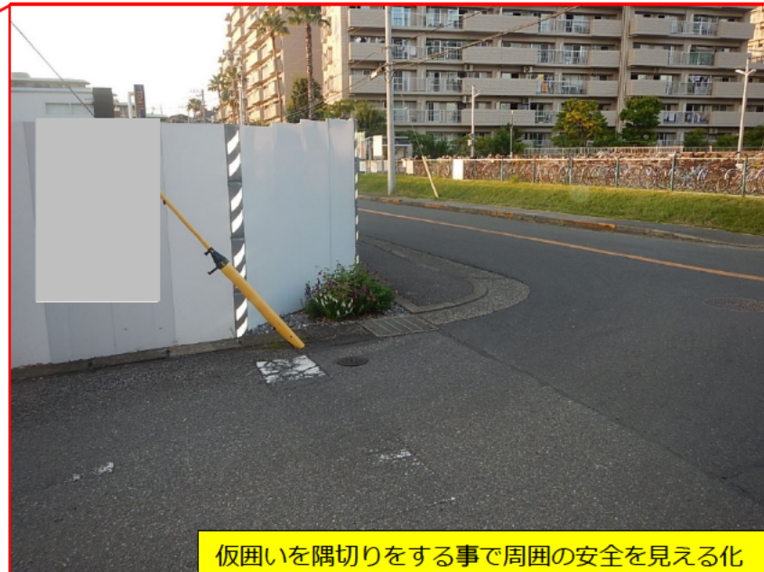
仮囲いを隅切りをする事で周囲の安全を見える化