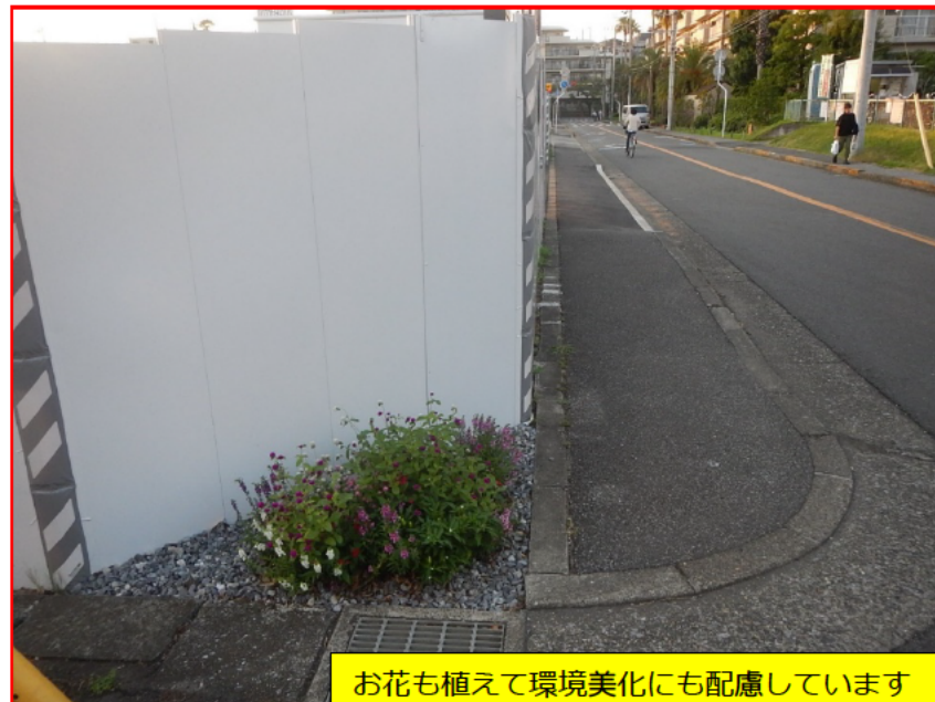
お花も植えて環境美化にも配慮しています