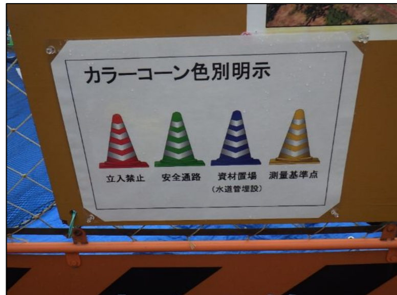
カラーコーン色別明示の掲示