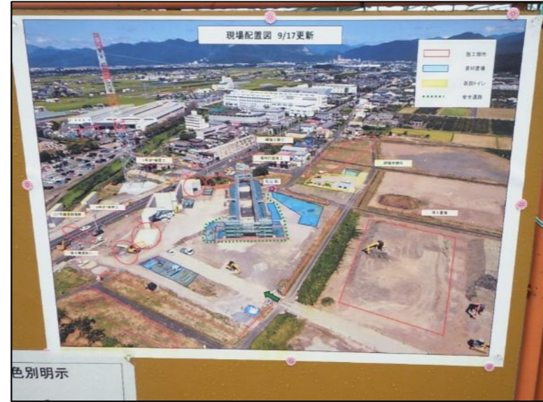
作業範囲配置図の掲示