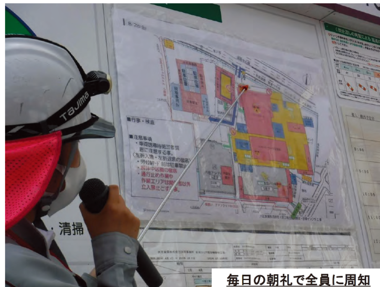
毎日の朝礼で全員に周知