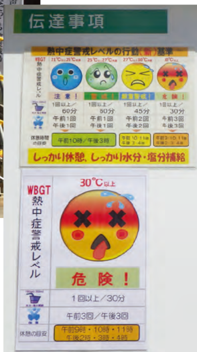
熱中症警戒レベルの掲示