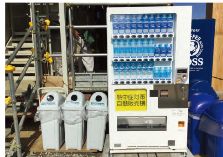
熱中症対策自動販売機の設置 (低価格での販売)