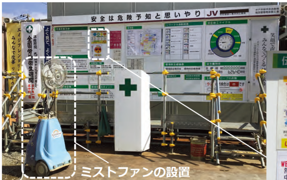
ミストファンの設置 朝礼時の熱中症対策