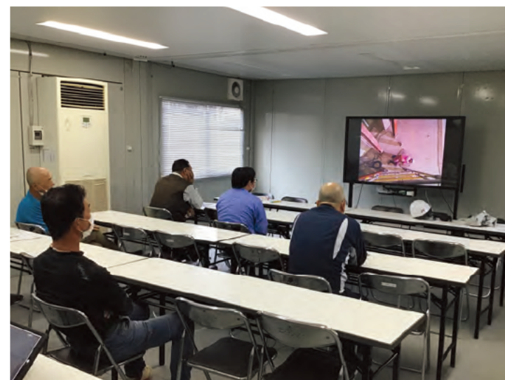
作業員へDVDによる熱中症教育実施