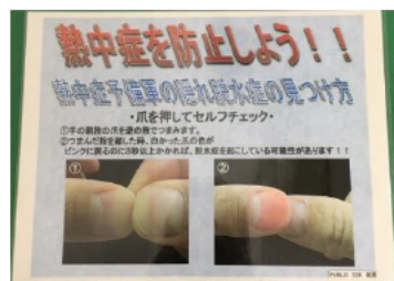
爪の状態による脱水判 定チャート