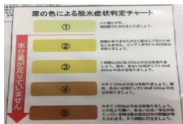
尿の色による脱水判定 チャート