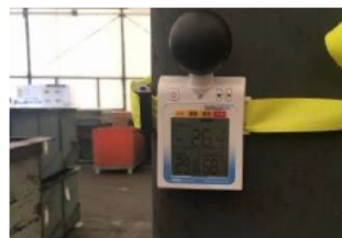
WBGT測定器の 各現場への設置

✓熱中症予防対策として、 職場に合ったWBGT値の基準 を見直し、全従業員へ周知を行いました。