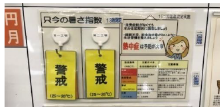
WBGT値基準の見える化 休憩所に只今のレベルを表示