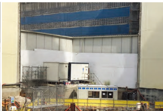
基礎躯体工事においてもクールダウンスペースを設置し、積極的に活用