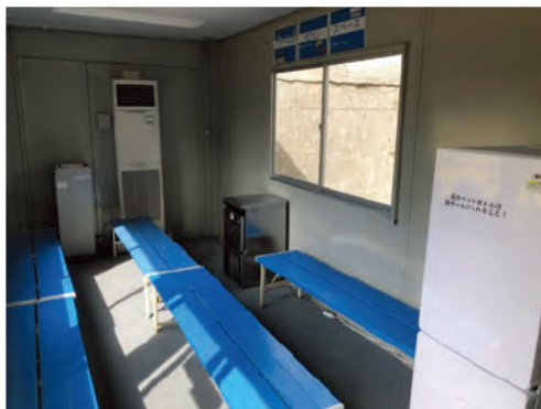
スポーツドリンク・経口補水液を完備