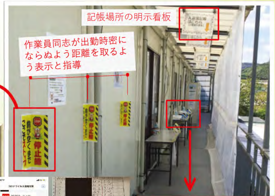
記帳場所の明示看板

元請当番社員が記帳の確認 → 高体温者・記帳不備者の職長へWowTalk発信 → 職長が作業員へ確認 → WowTalkで返信