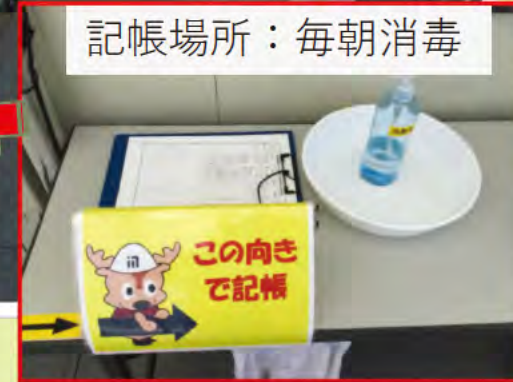
記帳場所：毎朝消毒