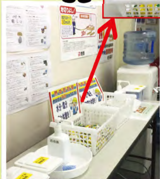
詰所には常時、熱中症飴・タブレット・ウォーターサーバー設置