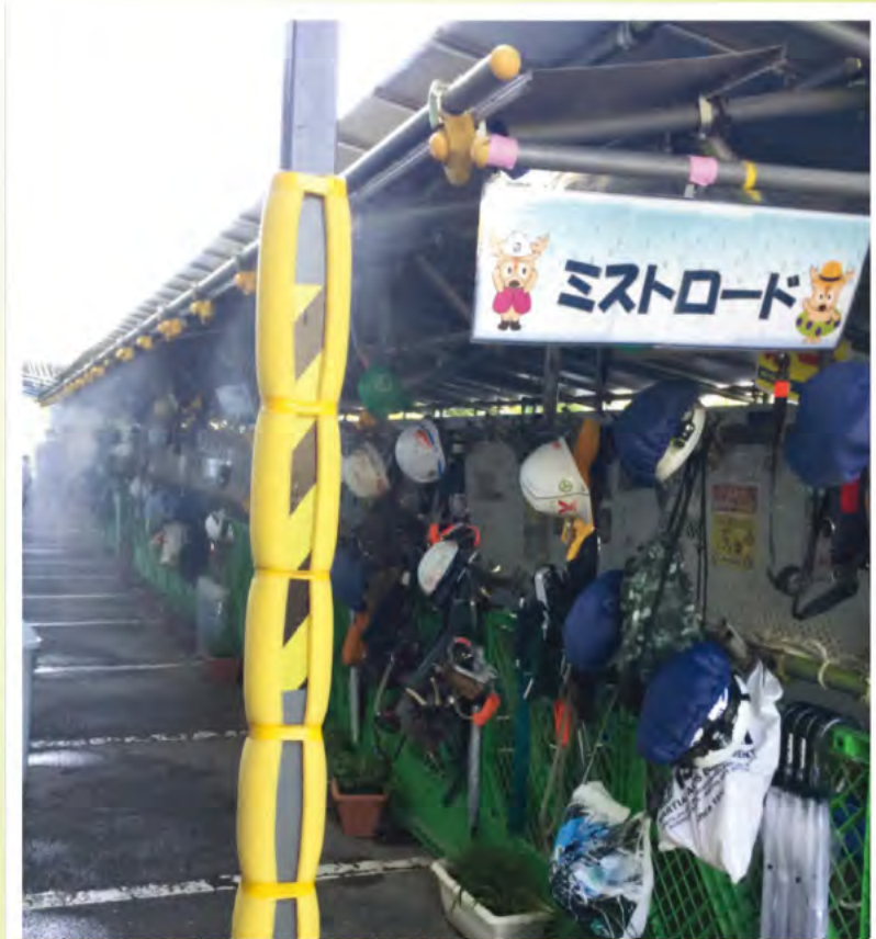
高温・高WBGT値指数時ミストロード活用