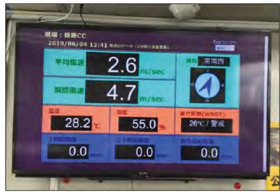
事務所の気象モニター