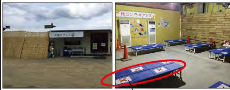
ベンチ使用箇所を制限し密にを避けている。

場外と場内の5か所にクールダウンスペース（オアシス）を設置し、涼しい場所で休憩を行える。