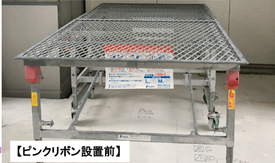
【ピンクリボン設置前】