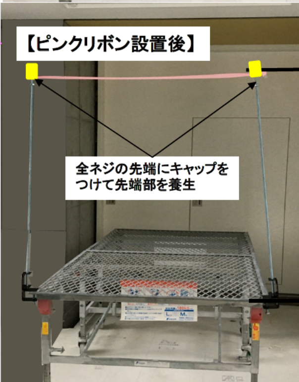
【ピンクリボン設置後】