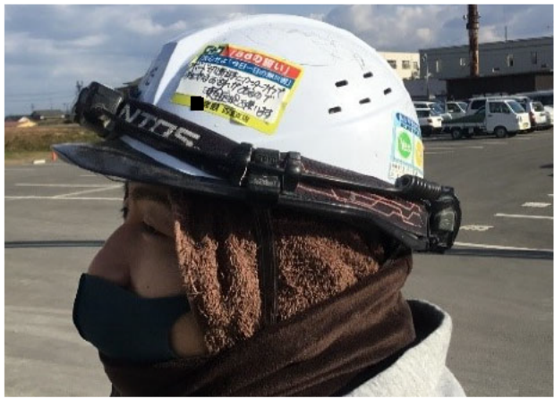
ヘルメットに表示

毎朝自分が守ると決めた 安全宣言を直筆で記入！ リスト以外にも自由に 設定してOK👍