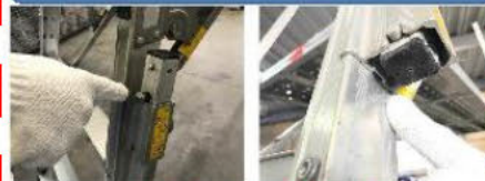
亀裂があれば 使用禁止