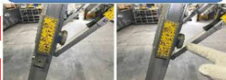
赤が見えたら未ロック状態