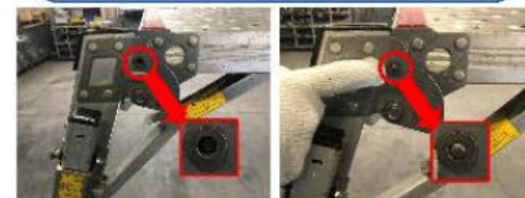
ピンが飛び出さない場合 使用禁止