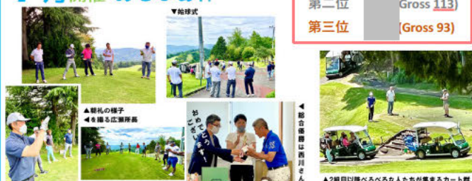
現場イベントの情報の見える化 →風通しの良い環境を実現

工程表、作業所長方針、時間外労働資料や現場イベント等、様々な情報が常時スライド投影されている 所員の意識改革やコミュニケーションツール・仕事のしやすい環境づくりに活用している