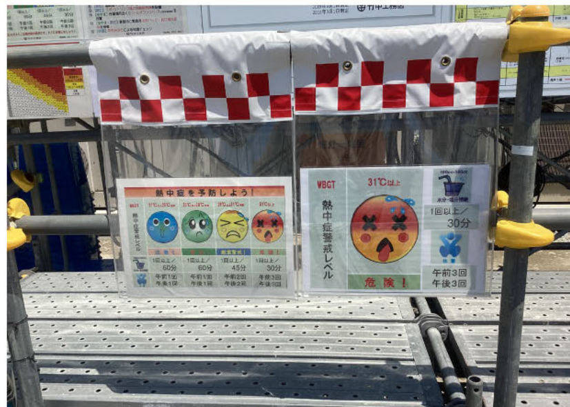
写真② 当日の熱中症警戒レベル掲示例