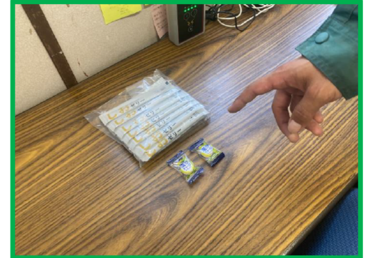
現場詰め所に補給水分塩分常備