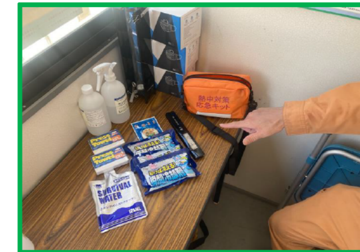
現場詰所に緊急グッズ完備