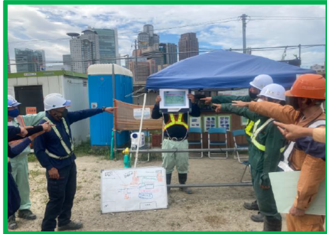
オリジナル熱中症安全5を掲示