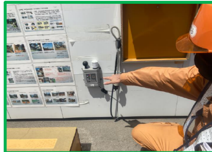
WBGT計・暑さウォッチャー設置