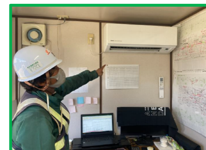
現場詰所にエアコン付き完備