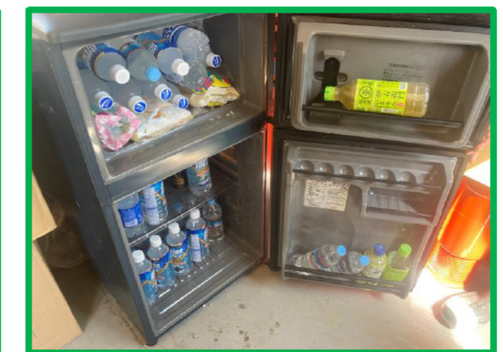
現場詰め所に冷蔵庫に水分常備