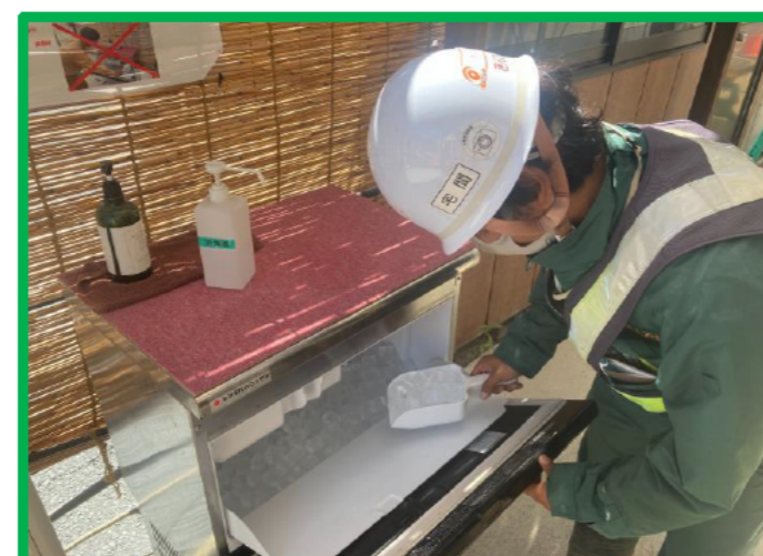
各所に製氷機・ウォータークーラー設置