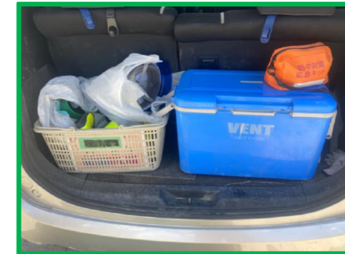
熱中症・コロナ対応緊急搬送車両待機