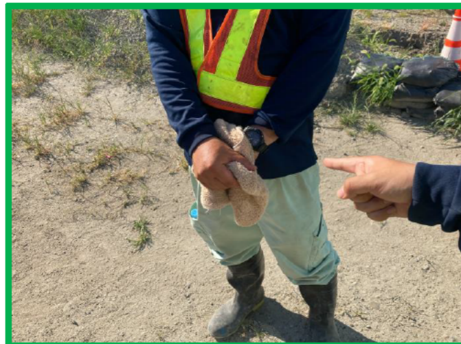
汗をこまめにふき取る