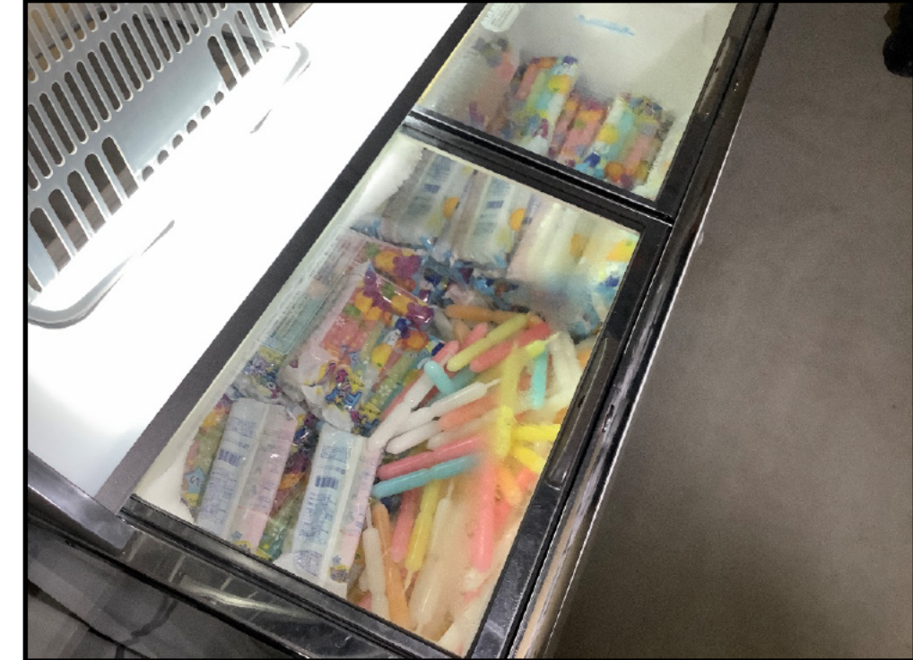
(9) 休憩所、無料アイスの配布