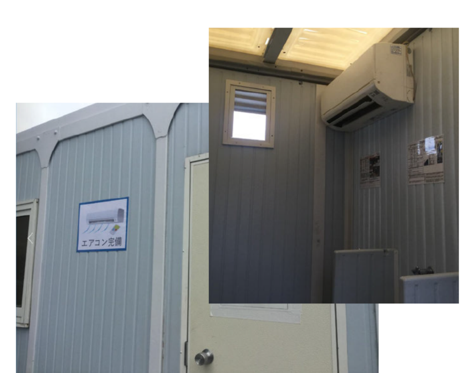
(12) 仮設トイレ内エアコン完備