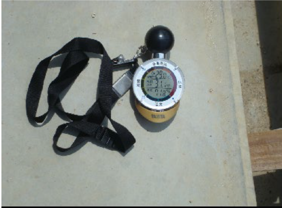
(1)巡回時WBGT値の現地確認