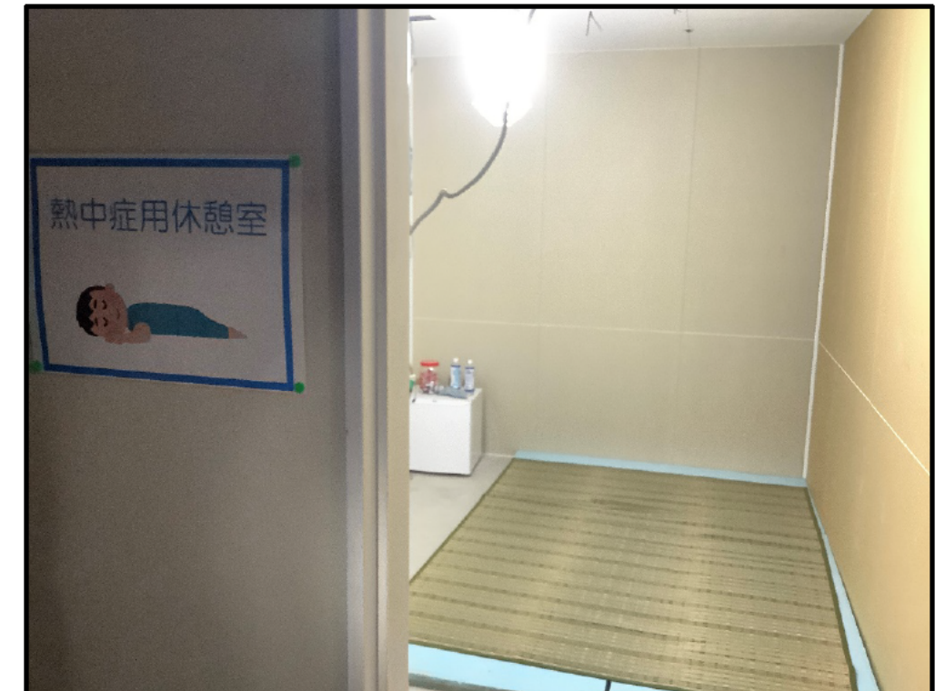
(6)万一の場合、横になれる熱中症休憩所の設置