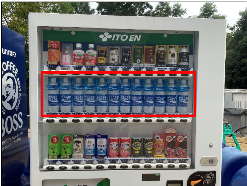
(10) 熱中症対策飲料増量、特別価格販売状況