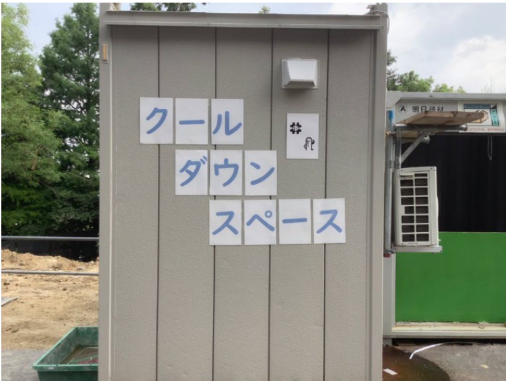
(4)クールダウンスペースの設置