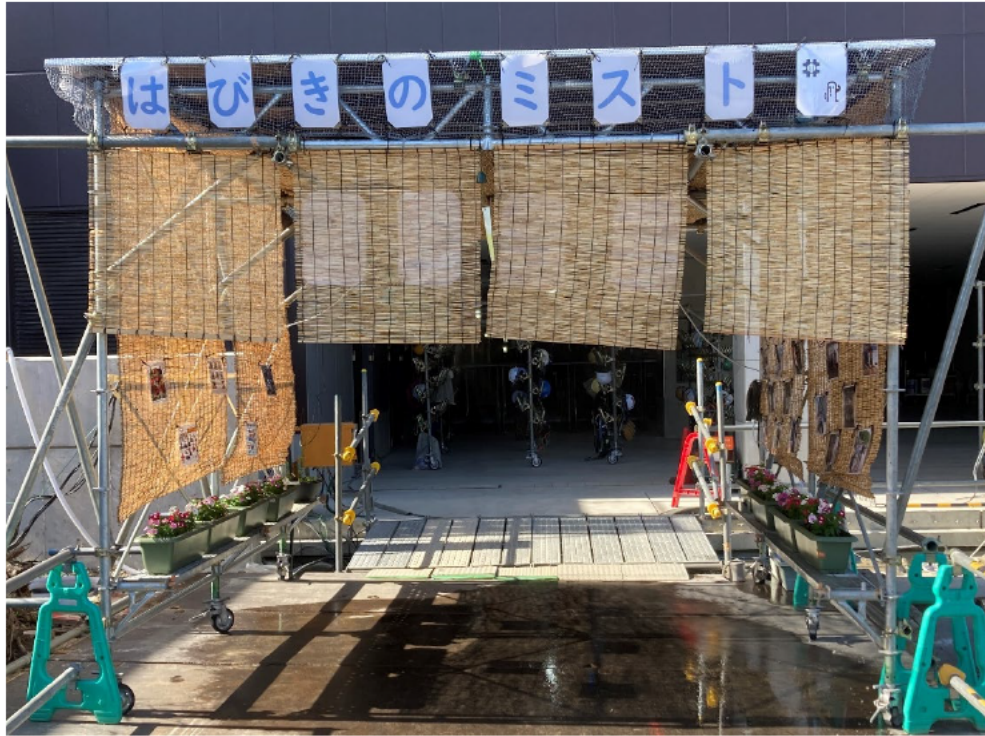
(7) はびきのミストロードの設置