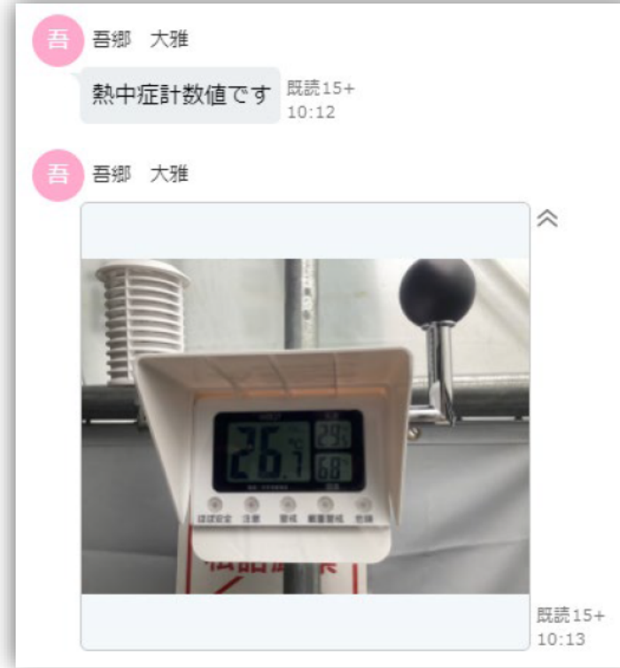
(2) WBGT測定器の設置と計測値を作業員へダイレクトメール配信