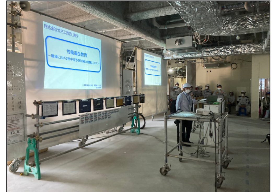
(3)熱中症説明会6/2に開催