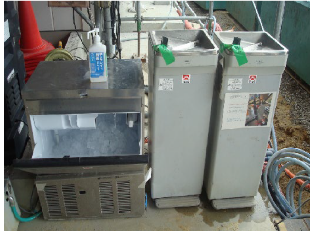
(8) ウォータークーラー、製氷機の設置