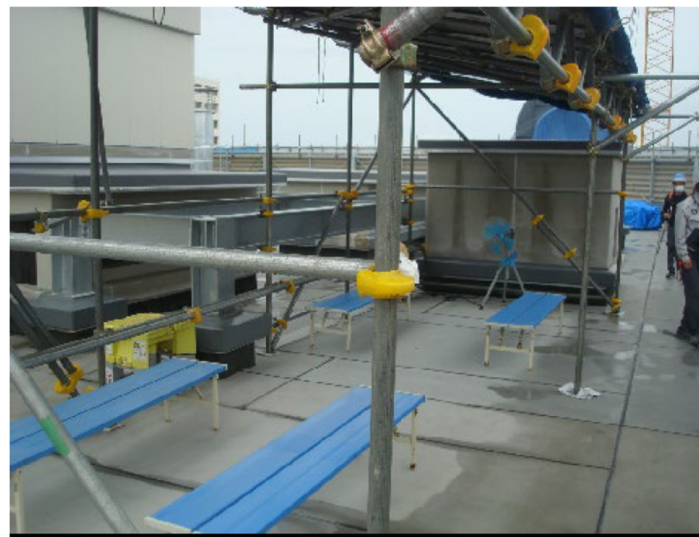
(11) 屋上階日よけスペースの設置