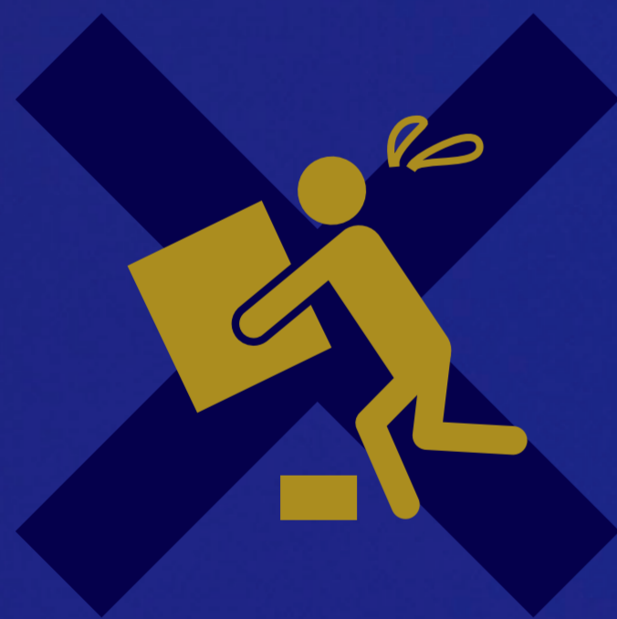
転倒災害防止部門