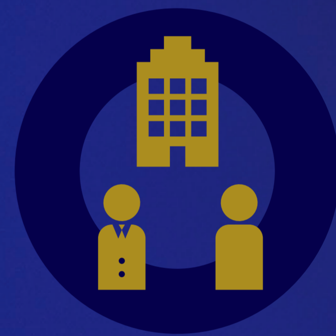
企業等間連携部門