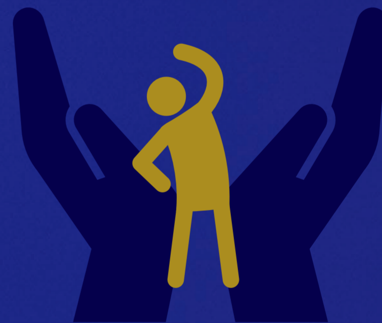
エイジフレンドリー部門

労働災害防止に向けた取組を実施している企業・団体に取組内容を応募いただき、優れた取組を部門別に表彰いたします。